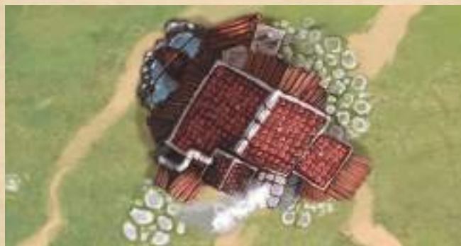
Мастерская - восстановите 2 жизни любому строению.