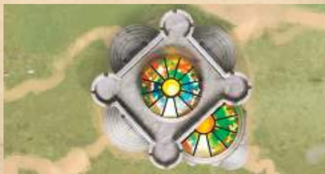
Библиотека - получите 1 ману.