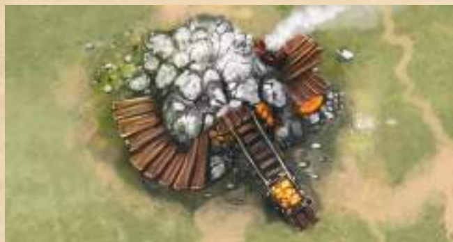
Золотая шахта - получите 2 монеты.