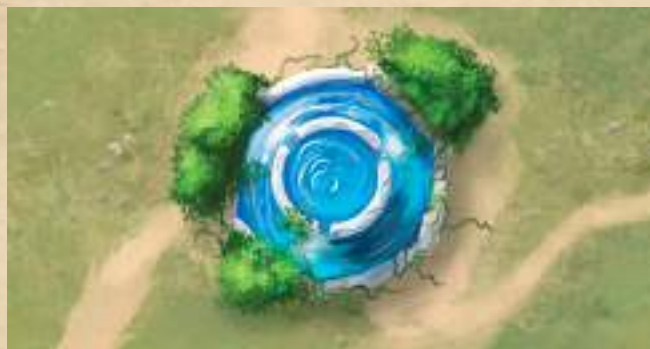
Исцеляющий фонтан - восстановите 2 жизни любому существу.