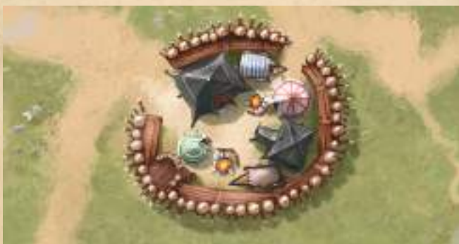
Военный лагерь - добавьте 3 к атаке существу на клетке.