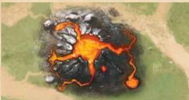
Разлом - 2 урона существу на этой клетке.