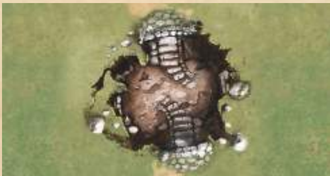
Подземелье - войдите в Подземелье.