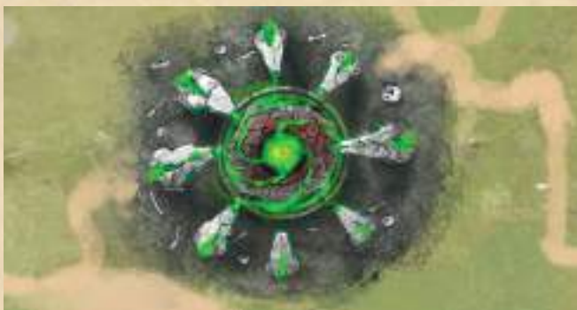
Алтарь проклятий - нанесите 2 урона магией существу противника.